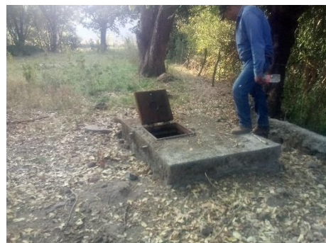
Inspección en líneas de conducción manantiales “El Guayabo” y “El Colomo”.