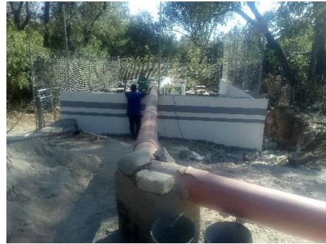
Visita técnica durante la construcción de la planta de tratamiento localidad de Jacales.