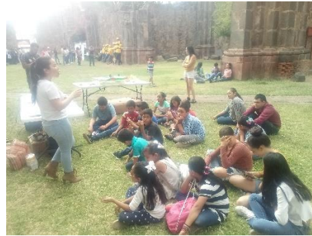
Celebración del 05 de junio "Día Mundial del Medio Ambiente" 2019.