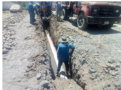
Construcción línea de atarjea red de drenaje en calle Insurgentes.