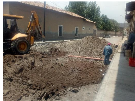
Construcción línea de atarjea red de drenaje en calle Justo Sierra.