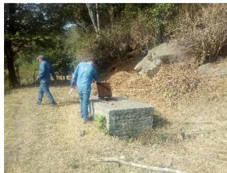
Inspección en líneas de conducción manantiales “El Guayabo” y “El Colomo”.