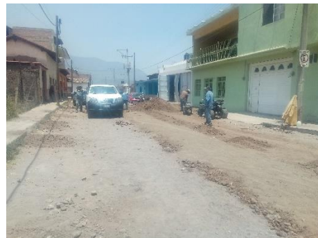
Construcción línea de atarjea red de drenaje en calle Venustiano Carranza.