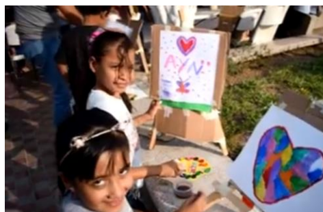
Celebración del Día del Niño en la plaza principal de Mascota, Jalisco.