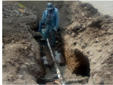
Construcción de crucero en red de agua potable sobre calle Juárez esquina Allende.