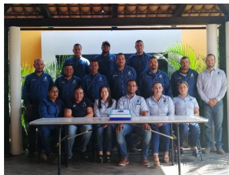
Capacitación del personal del organismo operador.