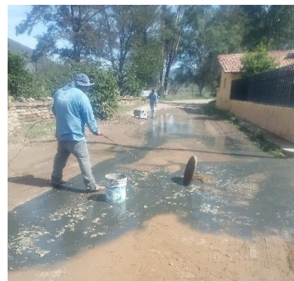
Trabajos de mantenimiento correctivo en línea de atarjea principal en localidad de Mirandillas.