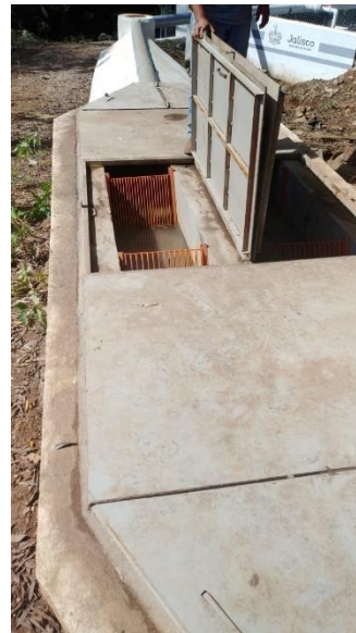
Colocación de cribas en etapa de pretratamiento de la PTAR en localidad de Jacales.