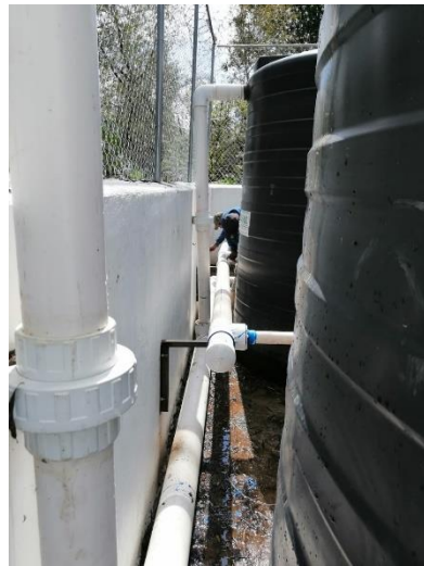
Trabajos de adecuación de tubería en PTAR de la localidad de Jacales.