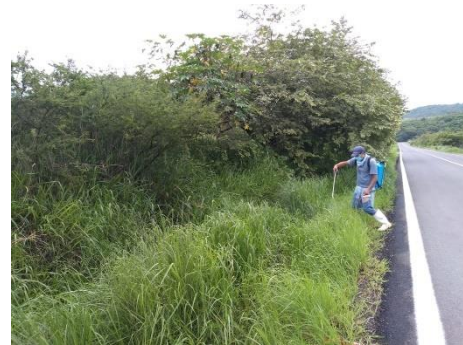
Trabajos de mantenimiento preventivo en línea de conducción El Guayabo.