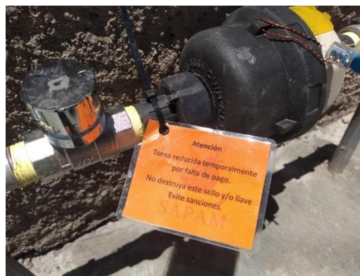
Entrega de notificación de adeudo y colocación de cuadro de medidor en domicilio con saldo moroso sin convenir.