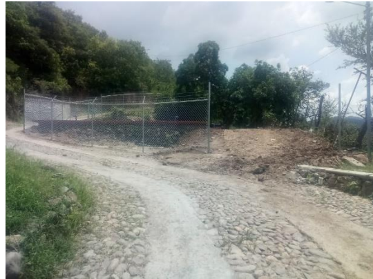
Trabajos de mantenimiento y renovación de cerca perimetral en tanques de almacenamiento.