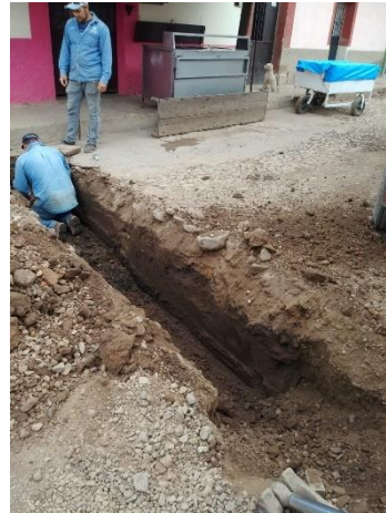
Renovación de línea de atarjea red de drenaje en calle Constitución.