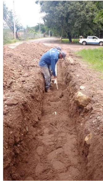
Renovación de la línea de conducción de las localidades Cruz Verde y El Refugio.