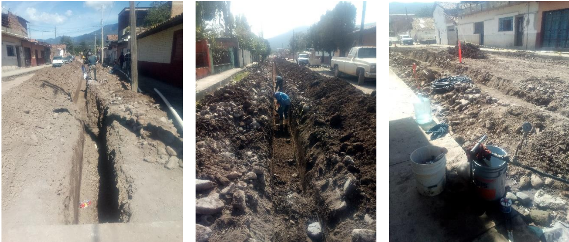
Supervisión de obra de renovación de red distribución de agua potable sectores 12 y 13.