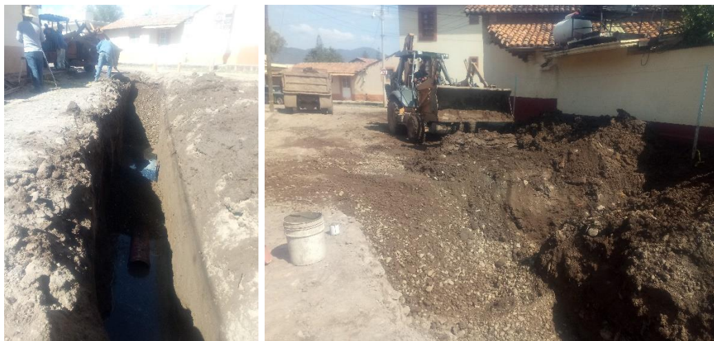
Trabajos de reparación de tubo subcolector de 12" en calle Hilarión Romero Gil.