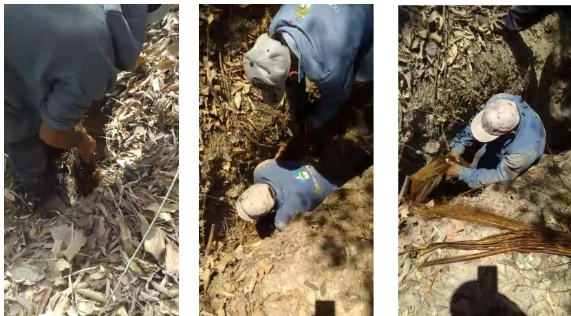
Imagen 2.4. Mantenimiento de la línea de conducción El Guayabo.