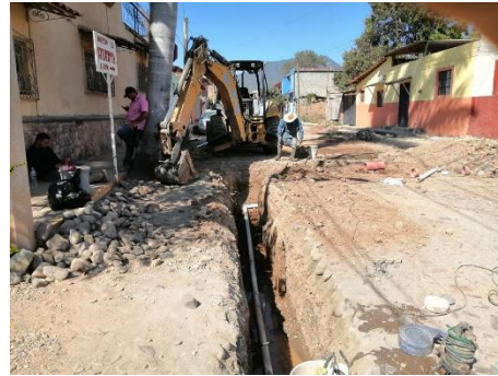
Imagen 2.2. Construcción de crucero red de agua potable en calle Emiliano Zapata.