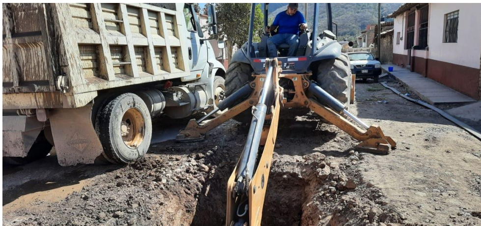
Imagen 2.3. Reparación de colector de drenaje en calle Pino Suárez.