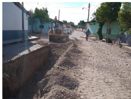
Imagen 2.1. Renovación red de drenaje en calle Insurgentes.