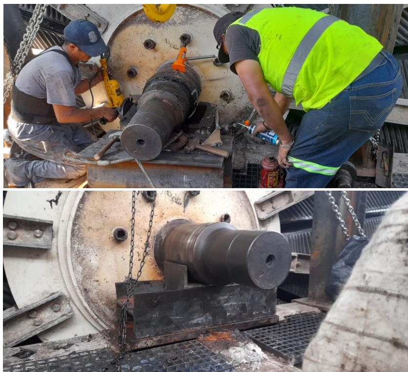
Imagen 3.1. Trabajos de reparación de la PTAR en Mascota.