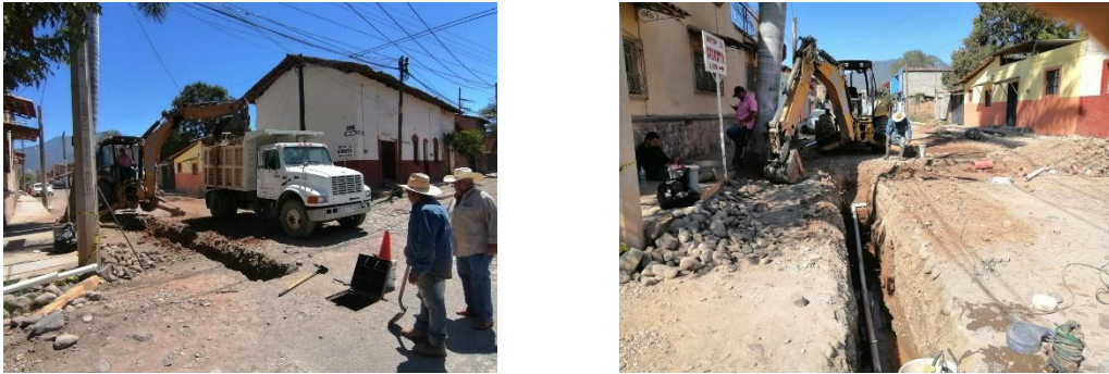
Imagen 2.2. Construcción de crucero red de agua potable en calle Emiliano Zapata.