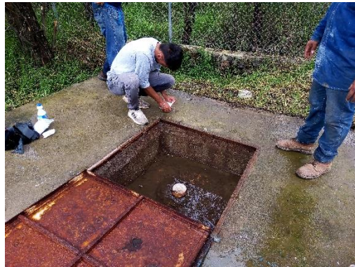
Imagen 3.2. Trabajos de mantenimiento en PTAR, localidad de Mirandillas.