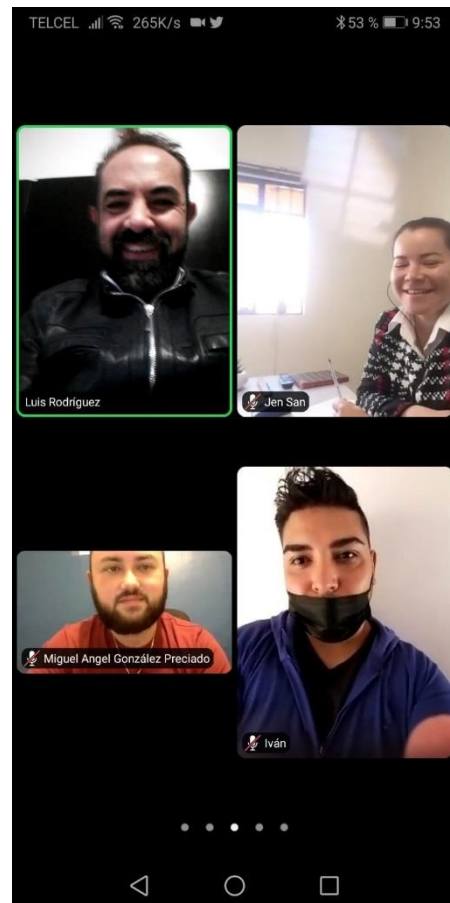
Imagen 4.1. Taller virtual realizado para los Espacios de Cultura del Agua de la región.