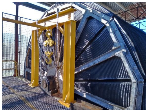
Imagen 3.1. Culminación trabajos de reparación de la PTAR en Mascota.