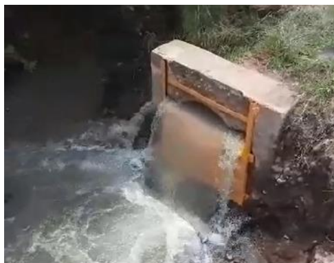
Imagen 2.5. Colocación de compuerta en tubería de excedencias del cárcamo de bombeo.