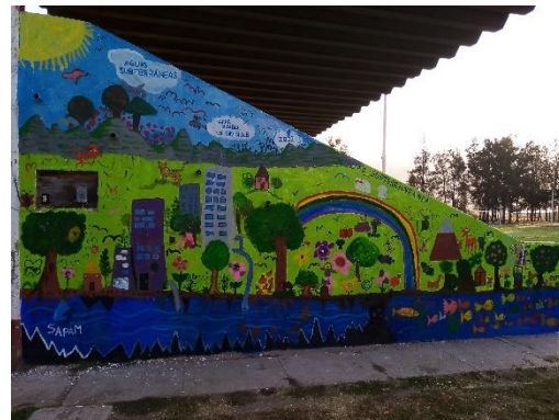
Imagen 3.2. Elaboración de mural en la unidad deportiva Rafael Galindo.