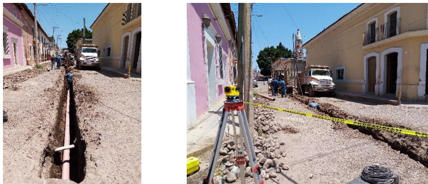
Imagen 2.6. Extensión de red de drenaje en calle Juárez.