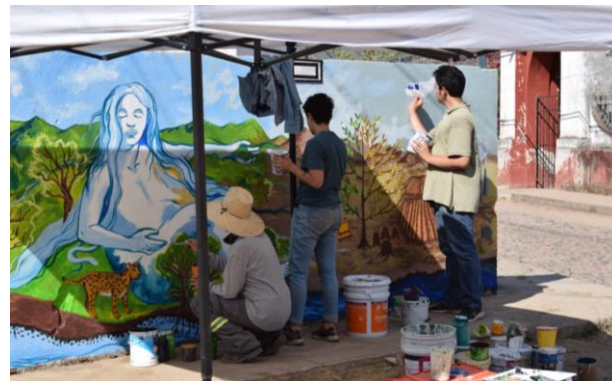
Imagen 3.3. Elaboración de mural en el cruce de las calles Libertad y Rosa Dávalos.