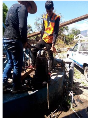
Imagen 2.1. Mantenimiento en equipo de bombeo.