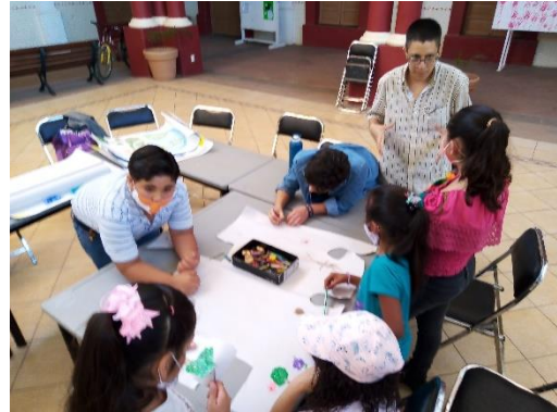
Imagen 3.1. Elaboración de bosquejos para pintar los murales.