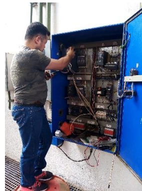
Imagen 2.2. Configuración de variador de frecuencia.