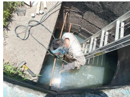
Imagen 2.3. Reparación de cribas en cárcamo de bombeo.