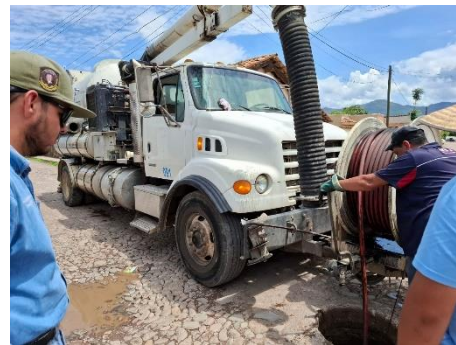
Imagen 2.2. Mantenimiento de la red de alcantarillado con equipo hidroneumático.