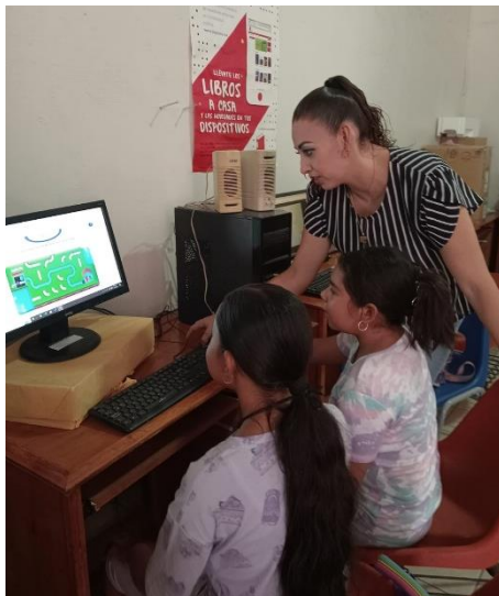
Imagen 3.1. Eventos reportados en la plataforma de la CEA Jalisco.