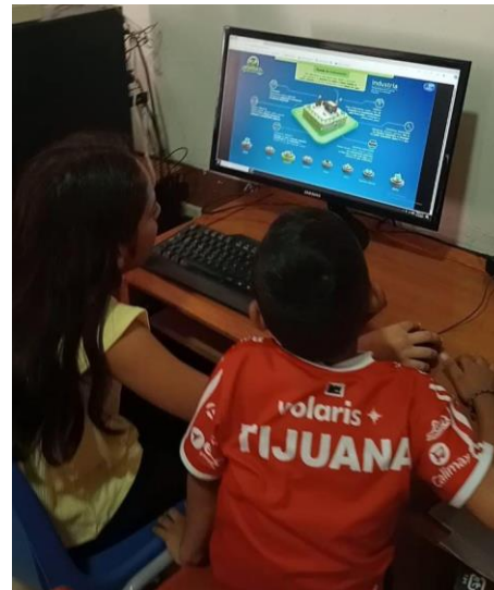
Imagen 3.2. Presentación de la plataforma "Guardianes del Agua".