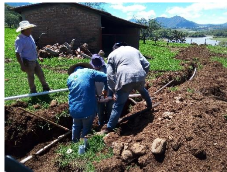
Imagen 2.1. Obra de renovación de línea de conducción en localidad La Providencia.