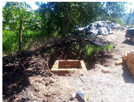
Imagen 2.3. Caja de válvulas en obra de extensión de red de agua potable calle Prolongación Juan Álvarez.